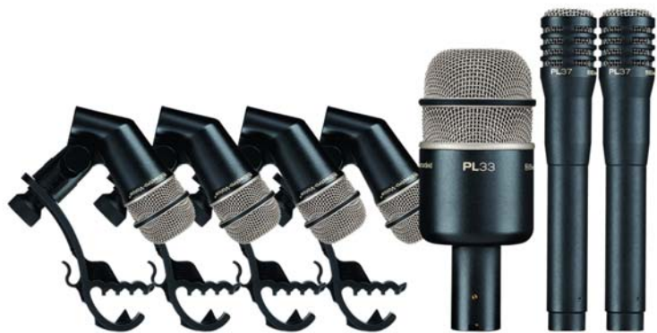
写真 : PL DK7 ドラムキット ¥102,900 税込(¥98,000 税抜)